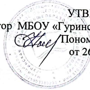
График работы консультационного пункта филиала МБОУ «Гуринская СОШ» «Детский сад д.Мижужева» на 2025-2026 учебный год